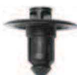
H011 push type cowl grille retainer